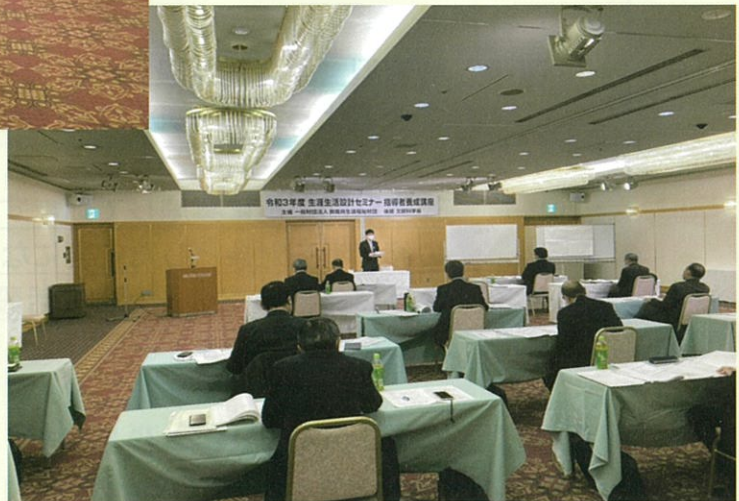
於 アルカディア市ヶ谷

※ 写真は令和3年度開催のもので、 本年度もマスク着用、参加者間の 距離を取る等、新型コロナウイルス感染 予防対策を徹底して実施します。