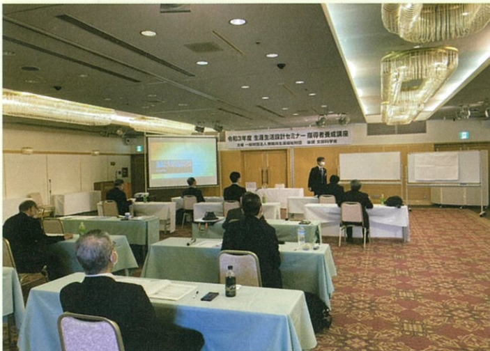
於 アルカディア市ヶ谷

※ 写真は令和3年度開催のもので、 本年度もマスク着用、参加者間の 距離を取る等、新型コロナウイルス感染 予防対策を徹底して実施します。